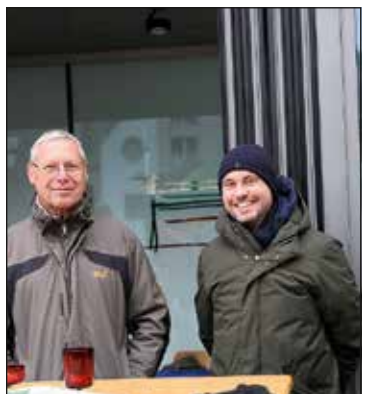
...am 01. Dezember auf dem Moselweißer Weihnachtsmarkt.