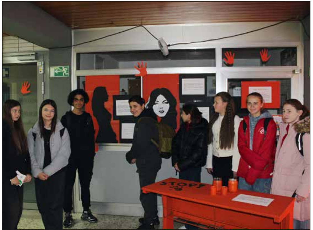
Ob 8. oder 10. Klasse – großes Interesse an den Ausstellungswänden zum ORANGE DAY an der RS Plus auf der Kartause. Hier am Infostand zur Organisation „Schattenschwestern“.

An diesem Montag fällt schon von weitem auf – das Gebäude sieht heute anders aus und ganz eindeutig ist das noch keine Weihnachtsdekoration. An Eingängen und Fenstern hängen orangefarbene Plakate und es recken sich unzählige orangefarbene Papphände entgegen. Im Haupteingang sind Frauen- und Mädchenporträts ausgestellt, es gibt eine Videoleinwand, auf der in den Pausen mit einem einstudierten Move und Musik aufgefordert wird, Gewalt gegen Frauen zu stoppen. Fast jeder Schüler, jede Schülerin und die Lehrkräfte tragen heute orange, vom Zopfband über Kapuzenpullis bis zu den Socken. In den Klassen und Auf-