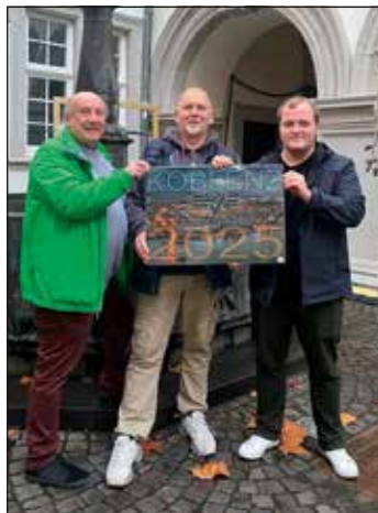
Foto Kalender von Koblenz setzt neue Maßstäbe