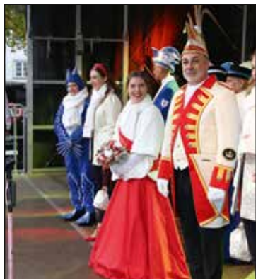
...am 11. November bei der offiziellen Karnevalseröffnung der AKK auf dem Münzplatz in der Altstadt.