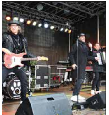
...am 11. November bei der offiziellen Karnevalseröffnung der AKK auf dem Münzplatz in der Altstadt.