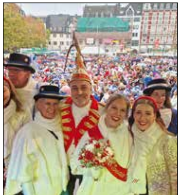
...am 11. November bei der offiziellen Karnevalseröffnung der AKK auf dem Münzplatz in der Altstadt.