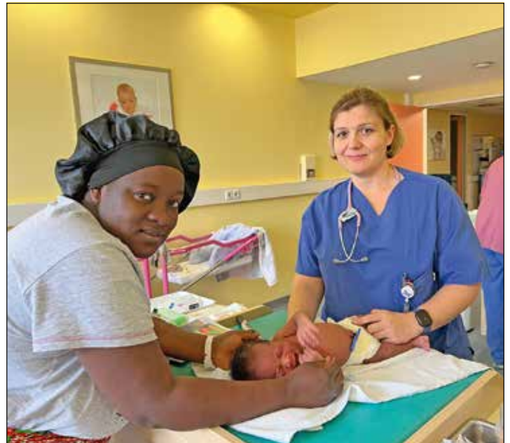
Im GK Mittelrhein können Säuglinge seit Beginn der Empfehlung gegen das RSV-Virus geimpft werden.

davon die Atemwege so stark betroffen, dass Krankenhausaufenthalte oder gar die Intensivstation erforderlich werden. Besonders bedroht sind Frühgeborene. Nun gibt es Hoffnung. Seit einigen Wochen ist eine sogenannte Passiv-Immunsierung möglich. Die Kliniken für Frauenheilkunde und Geburtshilfe und für Kinder- und Ju-