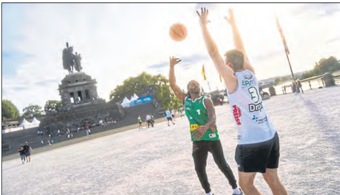
Vom Deutschen Eck in die ganze Republik: Die EPG Guardians müssen in der ProA im gesamten Bundesgebiet ran.