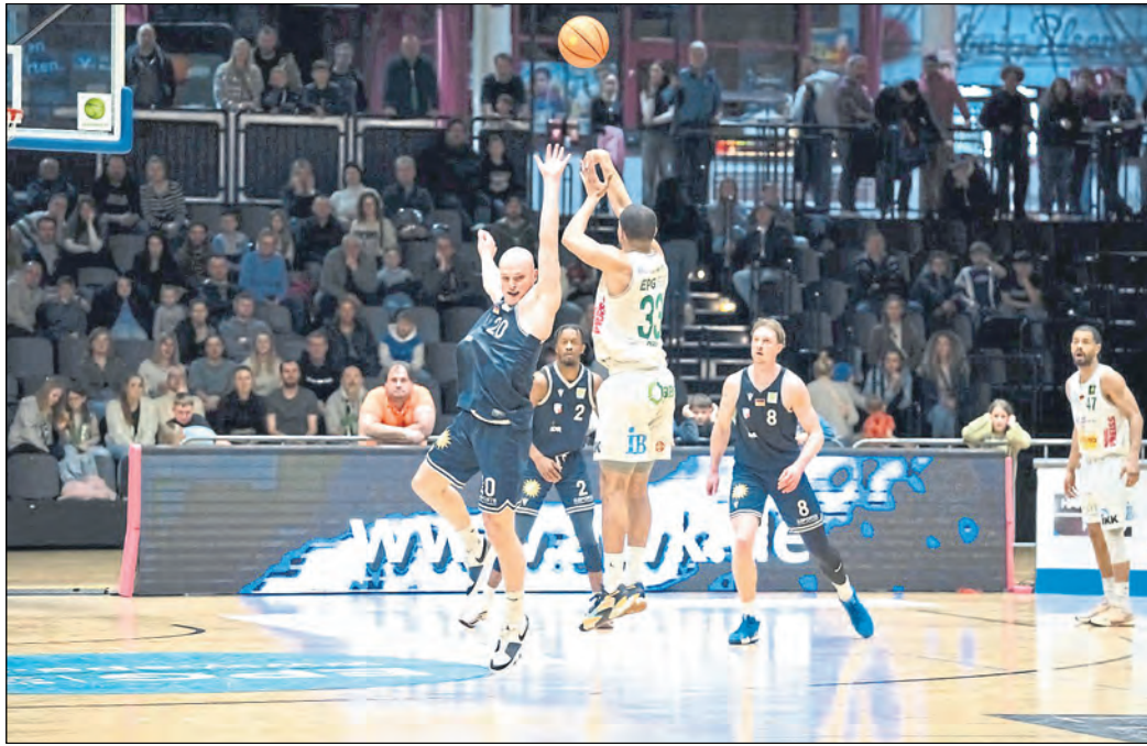
Nach einer Saison voller Höhen und Tiefen sicherten sich die Koblenzer den Klassenverbleib.

Es begann alles so vielversprechend. Nach dem Aufstieg aus der ProB gingen wir voller Enthusiasmus und mit einer Menge Rückenwind in die neue Saison.