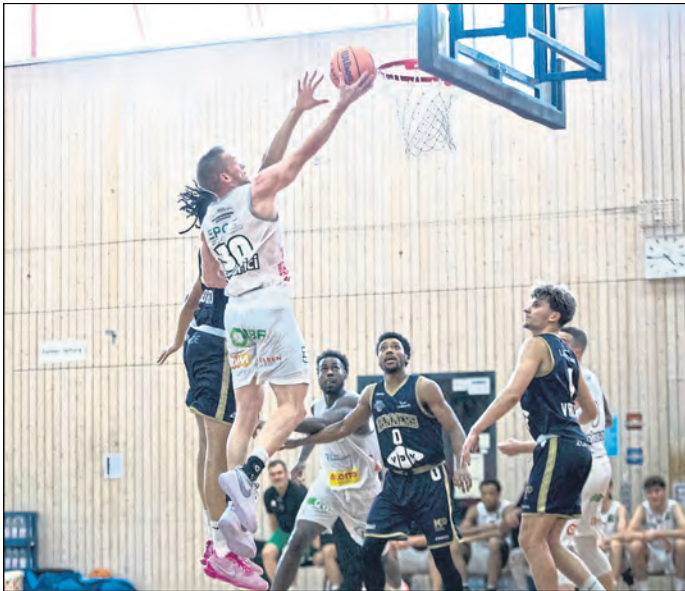
Die EPG Guardians Koblenz gehen in ihre zweite Saison in der zweithöchsten deutschen Spielklasse.

Die Hauptrunde beginnt am 20. September 2024 und erstreckt sich über 34 Spieltage bis zum 26. April 2025. Die Playoffs beginnen dann im Mai 2025 und versprechen hochklassigen Basketball, bei dem sich die besten Teams der Liga um die begehrten Aufstiegsplätze duellieren. Highlight-Spiele für die EPG Guardians Koblenz sind am