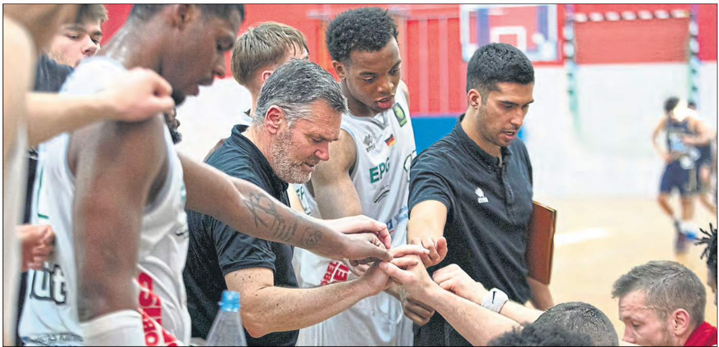
Die EPG Guardians wollen mit Teamgeist als Einheit erfolgreich sein auf dem Spielfeld.

Was war Euer Highlight bisher in Koblenz und worauf freut Ihr