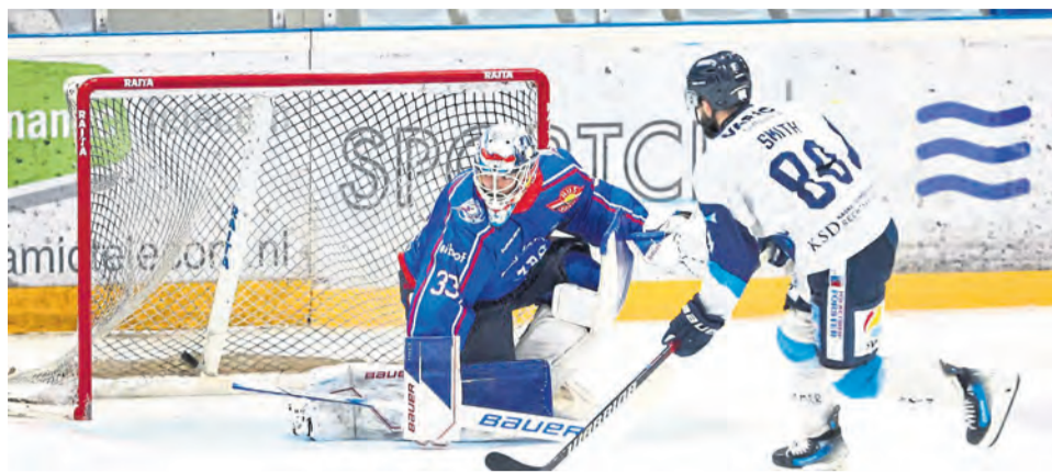
Alleine gegen den Torwart: Wenn nach 65 Minuten kein Sieger feststeht, fällt die Entscheidung im Penaltyschießen, so wie hier im fünften Play-off-Halbfinale gegen Den Haag.

• Central-European-Hockey-League-Cup: Neun Mannschaften (EHC Neuwied, Chiefs Leuven, EG Diez-Limburg, Heylen Vastgoed HYC, Lüttich Bulldogs, Mechelen Golden Sharks, Snackpoint Eaters Limburg, UltimAir Hijs Hokij Den Haag, Unis Flyers Heerenveen) nehmen am Wettbewerb teil. In der Hauptrunde spielt jeder Klub zweimal gegen jeden anderen – einmal zu Hause, einmal auswärts. Vier der neun Mannschaften erreichen