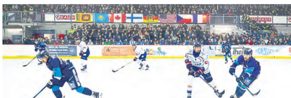
Das klassische Icehouse-Feeling kann der Stream nicht ganz originalgetreu transportieren, für den Notfall ist er aber eine Alternative.

NEUWIED. Wer ein Spiel der Bären nicht live aus der Halle verfolgen kann oder für wen die Auswärtsfahrten zu weit sein sollten, hat auch in der Saison 2024/25 die Möglichkeit, alle Partien der CEHL und des CEHL-Cups im Livestream zu verfolgen. Dabei gibt es ab dieser Saison die Auswahl zwischen drei Abonnementstufen. Hier hat man neben dem „normalen“ Basic-Abo die Mög-