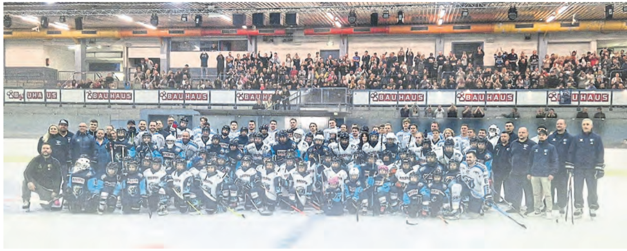
Erfolge in allen Altersklassen und steigende Spielerzahlen: Mit zahlreichen Spielen und Turnieren in der Saison 2024/25 bietet der EHC Neuwied seinen Nachwuchsspielern viele Gelegenheiten, sich zu beweisen.