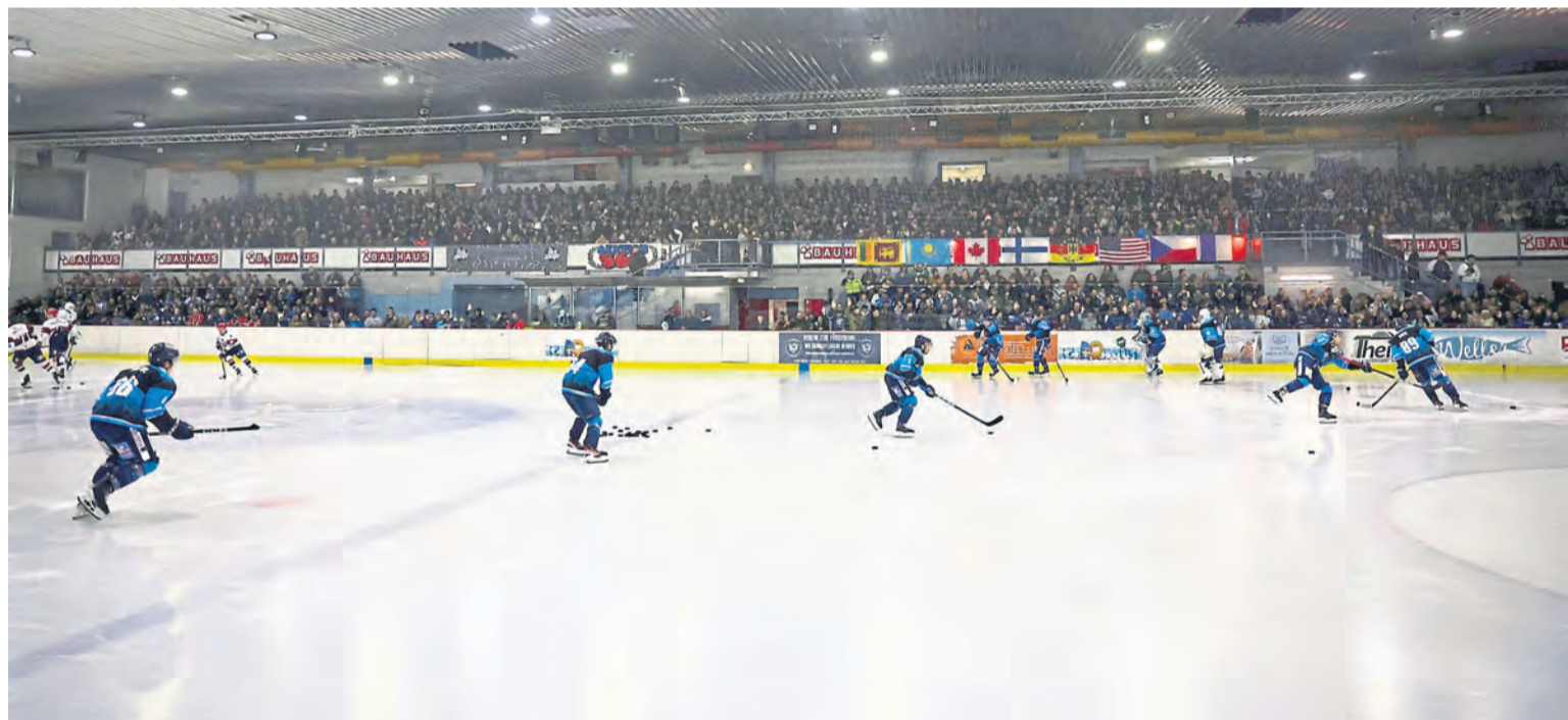
Die Bärenhöhle wird auch in der Saison 24/25 wieder gut besucht sein bei den Heimspielen des EHC Neuwied.

dogs geschlagen geben. Neuaufgabe? Sogar noch eine Stufe weiter nach oben? An diesem Wochenende beginnt die Saison 2024/25. Die Gegner bleiben die gleichen, der Name der Liga ändert sich. Aus der BeNe League wird die Central European Hockey League (CEHL). Mit der Umfirmierung will der Ligavorstand ein klares Zeichen setzen, dass die Tore nach der Aufnahme von Neuwied und der EG Diez-Limburg auch für weitere nicht aus Belgien und den Niederlanden stammende Vereine geöffnet bleiben. „Ein weiterer Schritt hin zur Professionalisierung“, kommentiert Billigmann. Im Frühsommer standen die Wechsel von zwei wei-