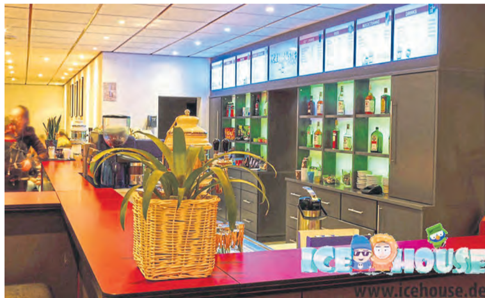
Das Bistro im IceHouse ist die ideale Anlaufstelle, um sich während der Laufzeiten oder Heimspiele des EHC zu stärken.

Das Angebot reicht von Snacks wie Pizza bis hin zu einer vielfältigen Auswahl an kalten und heißen Getränken.