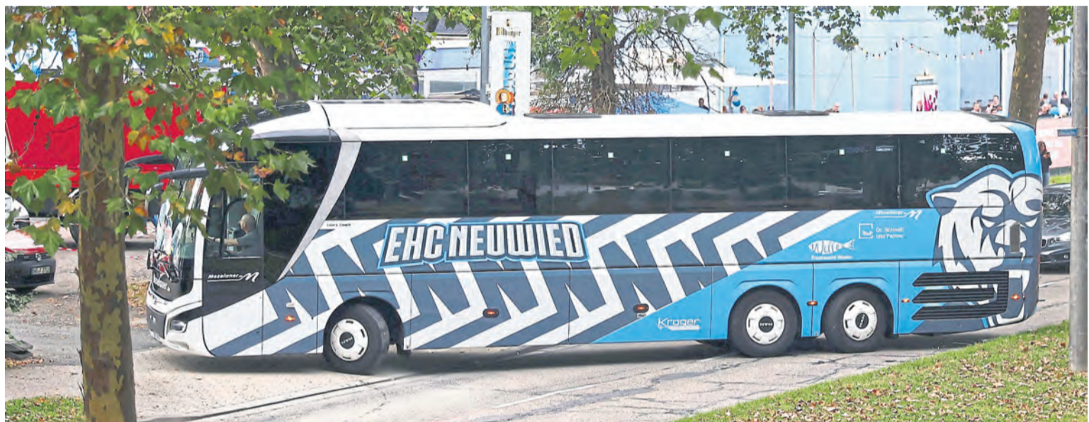
Ein echter Hingucker: Der neue Mannschaftsbus im schicken EHC-Design.