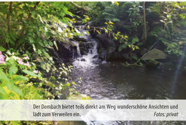
Der Dombach bietet teils direkt am Weg wunderschöne Ansichten und lädt zum Verweilen ein.