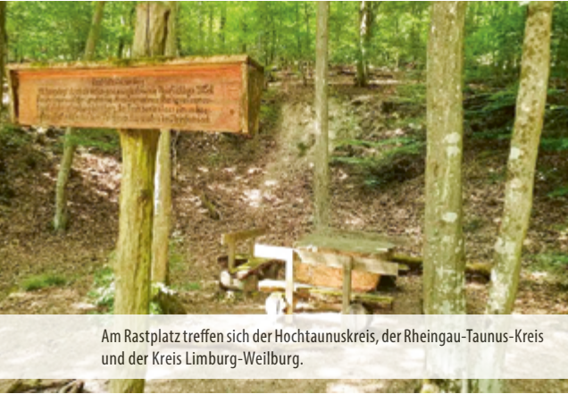
Am Rastplatz treffen sich der Hochtaunuskreis, der Rheingau-Taunus-Kreis und der Kreis Limburg-Weilburg.