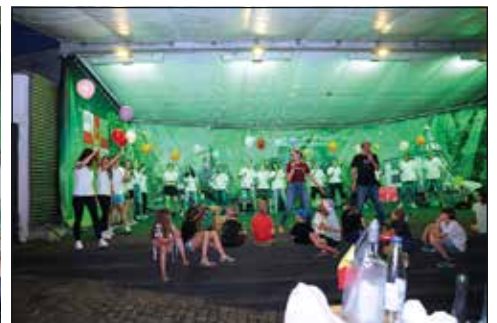
...auf der Moselweißer Kirmes.