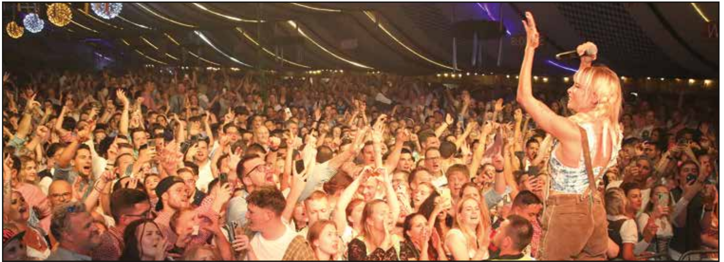
Die „Malle-Königin“ Mia Julia ist einer der vielen Top-Stars beim Koblenzer Oktoberfest.

Das zehnte Koblenzer Oktoberfest findet vom 13. September bis 12. Oktober statt